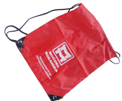
Se suministra con bolsa porta equipos tipo mochila