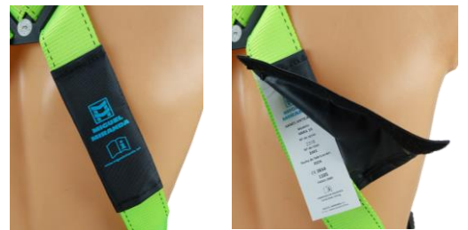
Etiqueta protegida con funda de nylon con velcro.